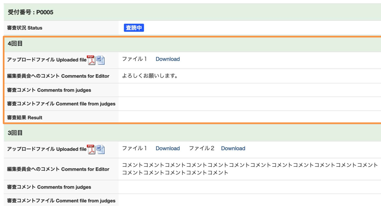
図 3-1 3 : 投稿詳細画面