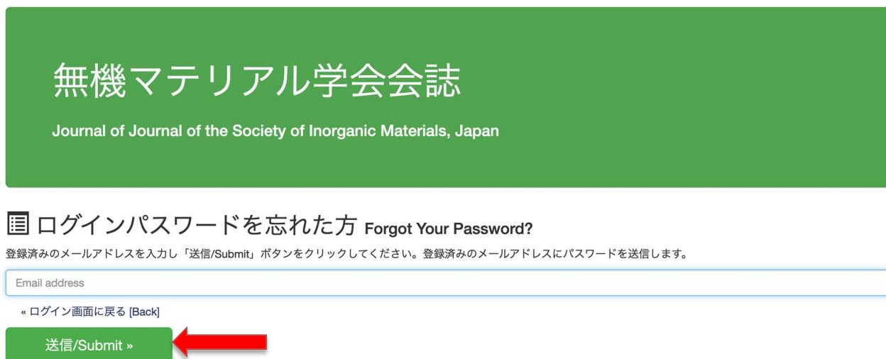
図2-3：ログインパスワードを忘れた方画面

パスワードを忘れた場合は、ログイン画面の「ログインパスワードを忘れた方」をクリックすると（図2-2）、パスワードの送信画面が表示されます。（図2-3）登録済みのメールアドレスを入力し「送信/Submit」ボタンをクリックします。登録済みのメールアドレス宛にメールでパスワードが通知されます。