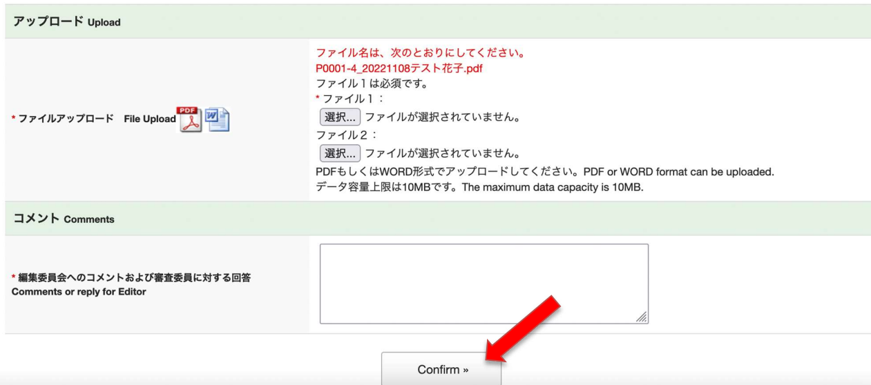
図3-10：再投稿フォーム

必要事項を記入の上「Comfirm」ボタンをクリックすると、確認画面が表示されます（図3-11）。